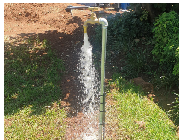
Iste Boorgatwater - 9 April 2023