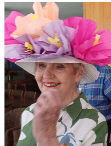
Lentetee Hoed Wenner