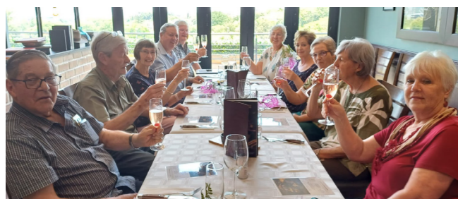
Die Trustees by Jaareind