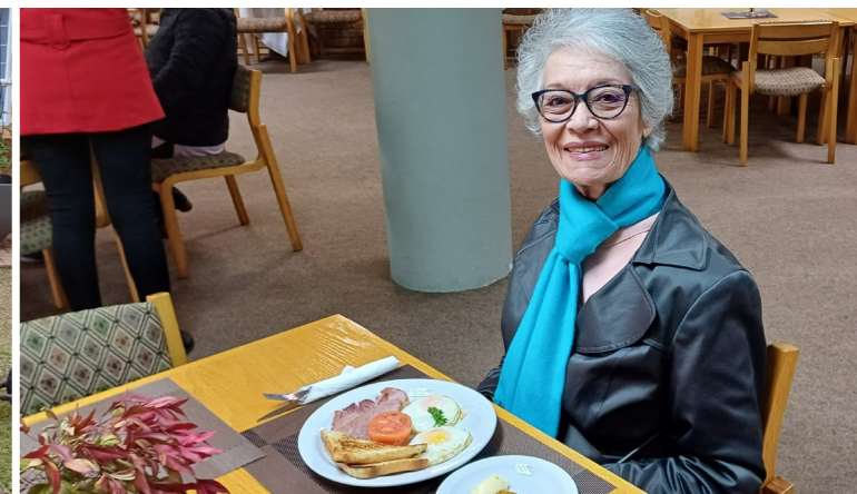
First Breakfast Guest